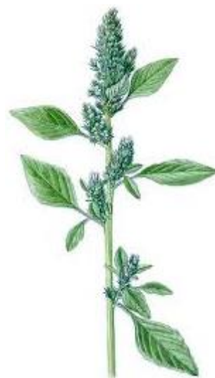
Amaranth – český laskavec

Ale abychom se vrátili k letošní návštěvě klubu seniorů, která se uskutečnila 24. 10. 2022 za hojné přítomnosti žen i mužů. Se žáky jsme připravili pásmo písniček a básniček, při kterých se nostalgicky vzpomínalo. Letos jsme se žáky vyrobili jako dárečky voňavá mýdla, někteří žáci připravili výrobky z keramiky. Na závěr celé akce jsme roztančili děti a snažili se zapojit i seniory na celosvětově známou píseň Jerusaléma. Za doznívající melodie jsme začali pracovat se seniory na vykrajování ozdob ze slanečného těsta. Podle ohlasů z řad přítomných bylo setkání příjemně stráveným odpolednem. Předběžně jsme se společně domluvili na návštěvě u nás ve škole někdy v prosinci. Budeme se těšit.