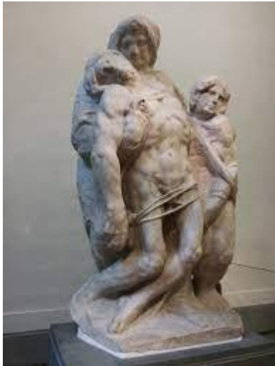
Pieta Rondanini (Civiche Raccolte d'Arte del Castello Sforzesco, Milán - poslední Michelangelovo dílo, nedokončená)