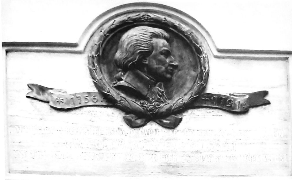
Pamětní deska W. A. Mozarta, Olomouc.

Do galerie nejvýznamnějších postav hudební historie vůbec se nepochybně řadí i Wolfgang Amadeus Mozart (1756-1791). Jeho dětství a mládí bylo plně v otcově režii, který jednak synův talent rozvíjel a zároveň jej jako zázračné dítě prezentoval po celé Evropě. Z toho snad pramení určitá nesamostatnost a povahová nezvralost, která Mozartovi způsobovala potíže v dalším praktickém životě. Mozartova mistrovská léta jsou spojena s pobytem ve Vídni, ni méně u císařského dvora nebyl vždy dobře přijímán, a tak pracuje převážně jako samostatný umělec. Z brilantní Mozartovy tvorby lze uvést opery, které patří ke stálému repertoáru velkých hudebních scén (Únos ze serailu, Figarova svatba, Don Giovanni, Così fan tutte - Kouzelná flétna), symfonická díla (symfonie D dur - Pražská, Es dur, g moll, C dur Jupiterská), koncertní skladby i díla vo (Ave verum corpus, Requiem).