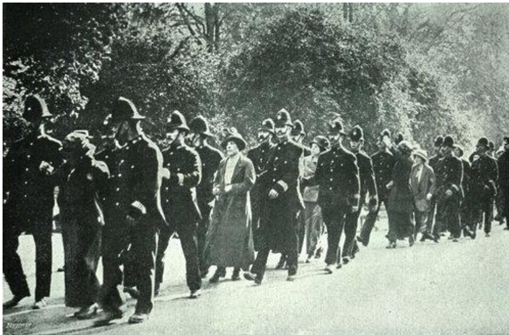
Cesta zatčených londýnských sufražetek na policejní úřad.

Metoda, jakou se WSPU pokoušela prosadit své postoje, byla poměrně jednoduchá – upoutat na sebe pozornost za každou cenu. A tak byly kromě protestních shromáždění v letech 1909 a 1911 podniknuty nájezdy na Dolní sněmovnu, zasílány výbušné poštovní zásilky, napadání ministři, policisté a nepřátelsky naladění novináři atd. Není proto divu, že se nezřídka dostávaly do křížku se zákony a výkonnou mocí, a kromě všeobecné známosti si získaly i mnoho nepřátel.